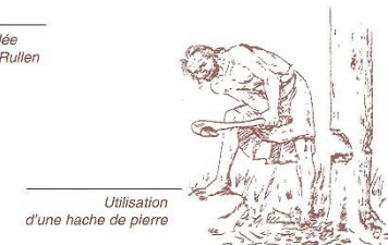
Utilisation d'une hache de pierre