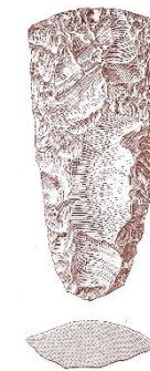
Hache taillée trouvée à Rullen